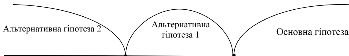
Рис. 4. Співвідношення основної гіпотези з альтернативними щодо формування в студентів англомовної лексичної компетенції.

Значення критерію Стьюдента t дорівнює 6,28. Як було зазначено вище, критичне значення розподілення Стьюдента t_{кр.} становить 1,99. Отриманий показник критерію Стьюдента t потрапляє в межі критичних значень і доводить більшу ефективність формування в студентів ЕГ англомовної лексичної компетенції (рис. 4).