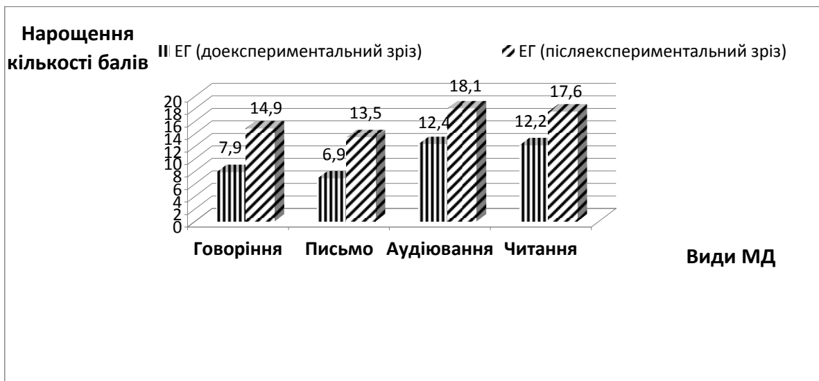
Рис. 2. Динаміка зростання рівня сформованості лексичних вмінь у всіх видах мовленнєвої діяльності в студентів ЕГ

На основі аналізу середніх показників рівня сформованості лексичних умінь у студентів експериментальної пари на початку та після завершення методичного експерименту була проаналізована динаміка зростання рівня сформованості лексичних вмінь у рецептивних і продуктивних видах мовленнєвої діяльності у студентів ЕГ і КГ за весь період тривалості формувального етапу експерименту (рис. 2, 3).