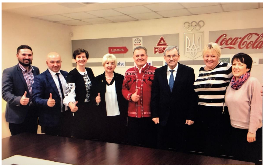
Засідання комісії НОК України «Закордонне українство». Київ, офіс НОК України, 28.11.2019 р.