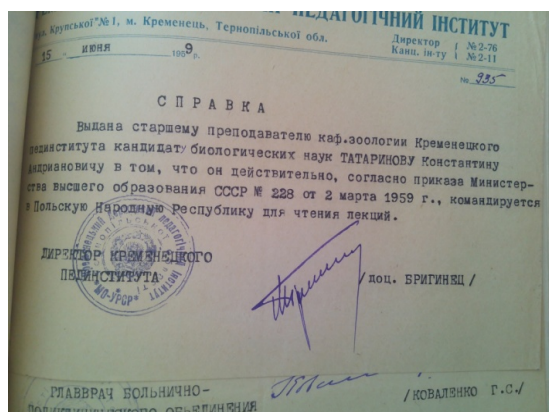
Рис. 1. Довідка про відрядження у ПНР для читання курсу лекцій із зоології.

Про це свідчить запрошення вченого до Познанського університету Польської Народної Республіки для читання курсу лекцій по зоології, зоогеографії, палеонтології та для збору наукового матеріалу (рис. 1). Однак, з невідомих причин, у червні 1960 року Управлінням зовнішніх відносин Міністерства вищої та середньої спеціальної освіти СРСР поїздку було відмінено (рис. 2).