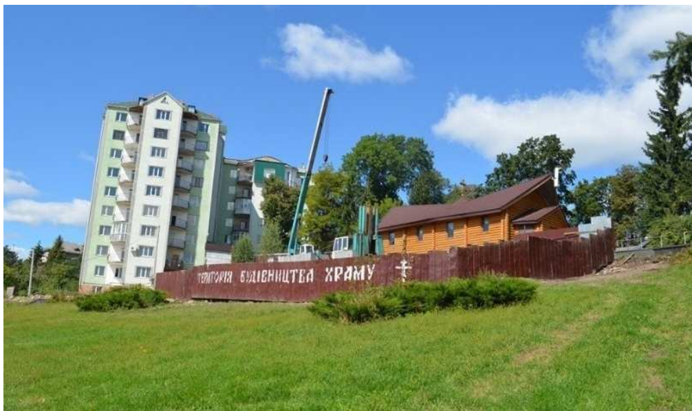
Рис. 2 Каплиця (тимчасовий храм) на честь ікони Холмської Божої матері (м. Луцьк, світлина 2012 р.) [20]

Проведений аналіз особливостей розташування та функціонування монастирів міста Луцька засвідчує формування біля них сучасних «випадкових» споруд, що спотворює історико-культурне та сакральне значення культо-