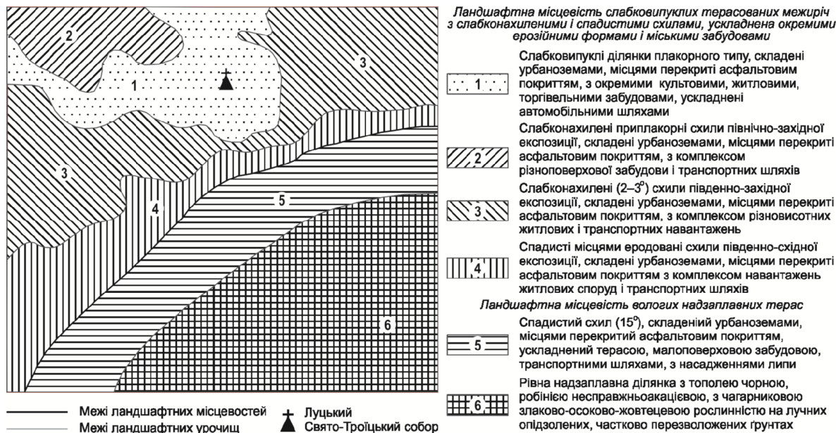
Рис. 1. Луцький Свято-Троїцький собор в структурі міських ландшафтних систем

та затверджених в установленому порядку зон охорони, відстань від будинків і споруд, які є пам'ятками культурної спадщини (архітектури та містобудування) до нових споруд повинна сягати подвійної висоти цих пам'яток, але у будь-якому разі – не менше 50 м, що забезпечить збереження цінного історичного розпланування і традиційний характер забудови населених пунктів, цінний природний ландшафт та об'єкти природно-заповідного фонду, оглядові точки і зони, звідки розкриваються види на пам'ятки та їх комплекси.