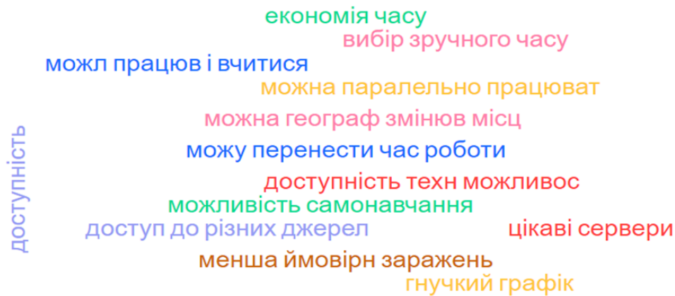
Рис. 1. Хмара плюсів дистанційного навчання

Серед недоліків дистанційного навчання зазначають: емоційну віддаленість учасників, психологічний дискомфорт, відсутність колективного духу, негативний вплив на здоров'я, недостатню кількість практики, тривалу роботу з комп'ютером, внутрішню неготовність працювати дистанційно тощо (рис. 2).