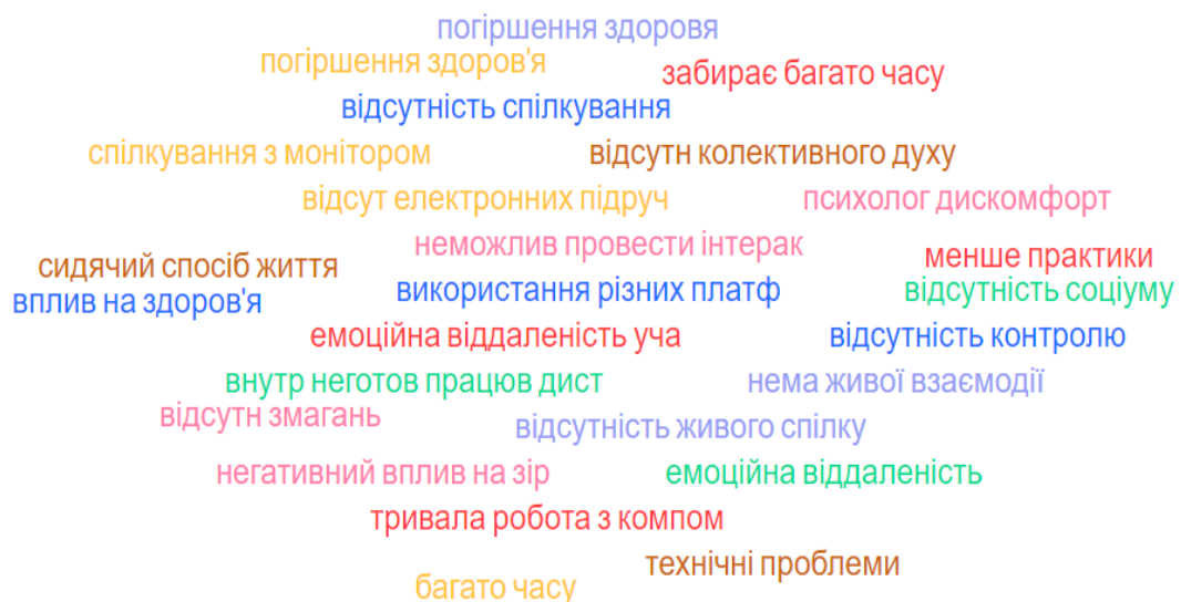
Рис. 2. Хмара мінусів дистанційного навчання

Прикметно, що ці дані співвідносяться із дослідженнями, що були проведені у інших ЗВО: найбільш відчутними за силою свого впливу недоліками дистанційної форми навчання здобувачі вищої освіти визначають індивідуальні, соціально-психологічні і фізіологічні особливості людини – підсумкова частка значущості цього фактору дорівнює 24% [1].