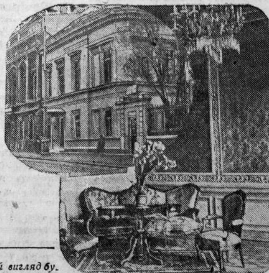
Угорі ліворуч: загальний вигляд будинку вчених; праворуч—одна з зал