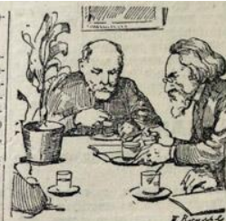
За стаканом чая протекает беседа...

— Читать! Все до одной, преподнесены в дар членами дома. Стоит посмотреть, как старательно прибирают их