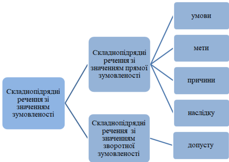
Рис. 1. Класифікація складнопідрядних речень розчленованої структури зі значенням зумовленості

У реченнях зумовленості називаються дві події, які зумовлюють одна одну, тому важливим для них є спосіб (модальність) складових членів. Вона може бути: