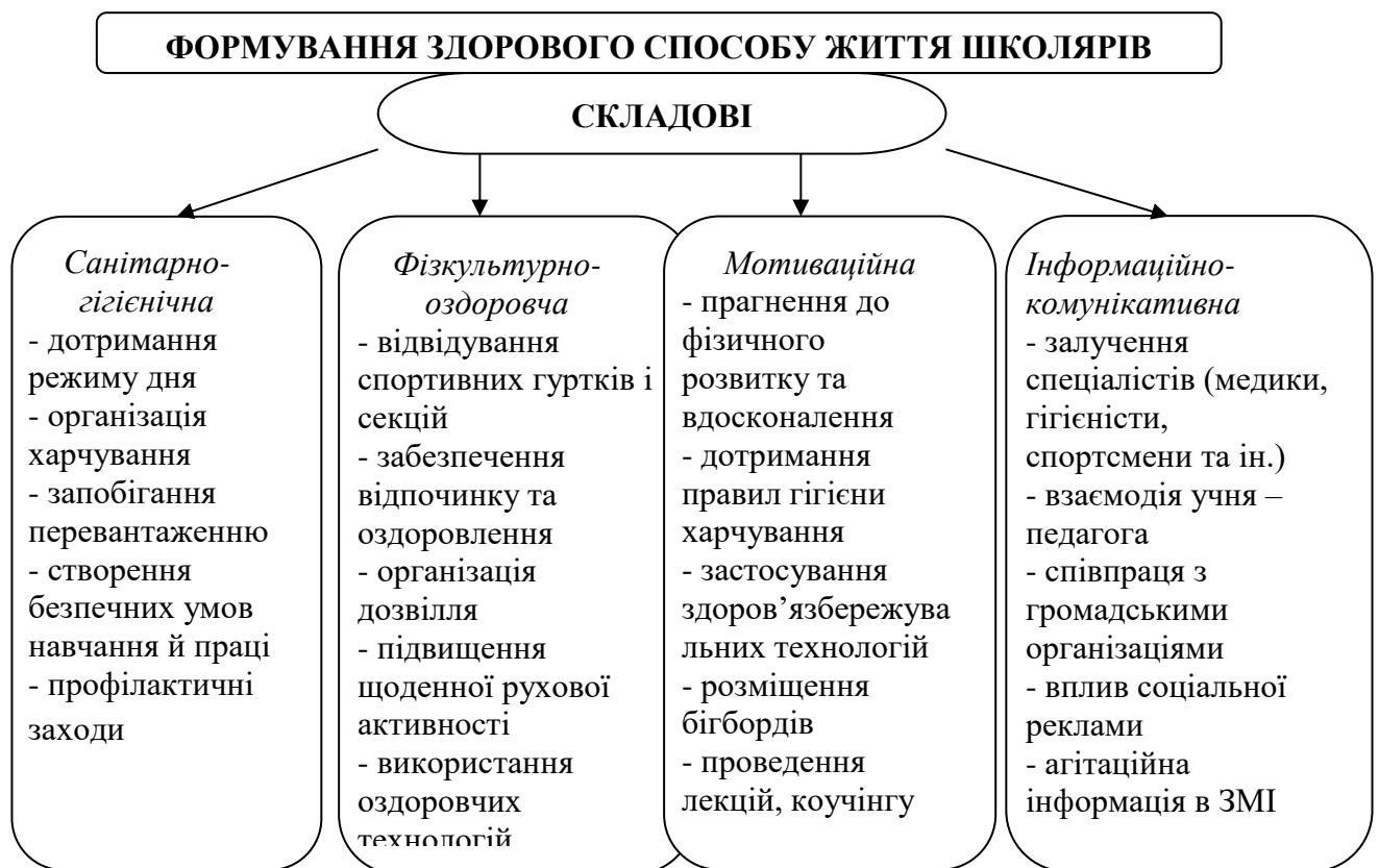
Рис.1.1. Складові формування здорового способу життя школярів

У поняття формування здорового способу життя школярів входять такі складові: (рис. 1.1.)